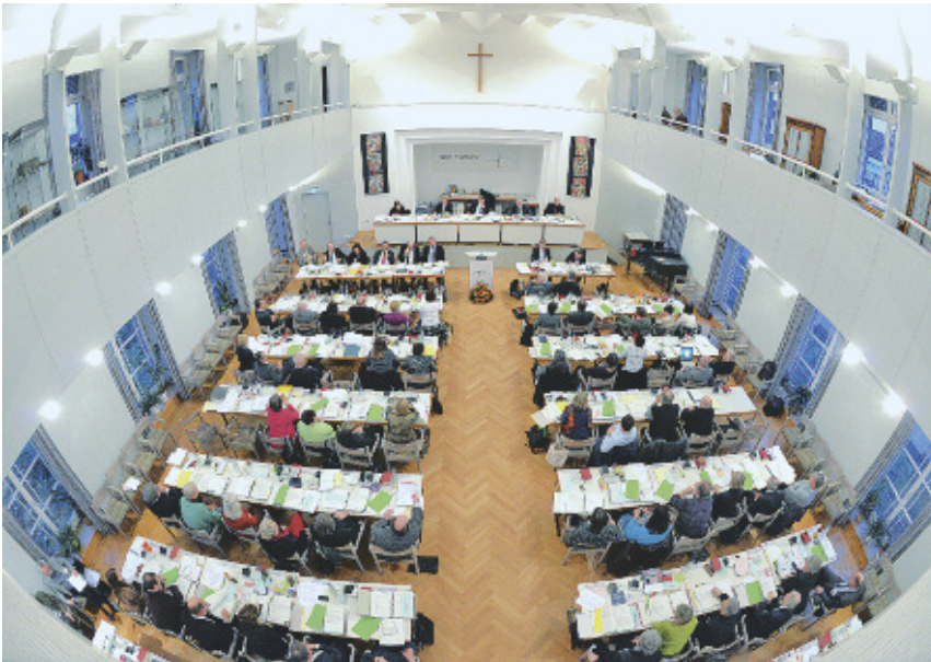
Inhaber der Kirchengewalt: Die Landessynode der unierten pfälzischen Landeskirche.

Moderne Kirchenordnungen verstehen Synoden als Inhaber der Kirchengewalt. Diese Synoden setzen sich aus gewählten Vertretern der Presbyterien zusammen und zwar so, dass die Laien immer die Mehrheit gegenüber den Geistlichen haben. Da sich die Kirchengewalt im Protestantismus von unten nach oben aufbaut, spricht man von einem presbyterial-synodalen System und bezeichnet damit das Gegenbild herkömmlicher Synoden, die, wie heute noch in der römisch-katholischen Kirche, reine Versammlungen von Bischöfen sind.