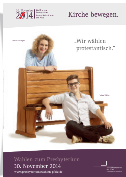
„Wir wählen protestantisch“: Jugend-Wahlplakat zur Presbyteriumswahl 2014.

dort sofort in die Bezirkssynode des Kirchenbezirks Homburg gewählt. In der Bezirkssynode ließ Stutz sich dann zur Wahl für die Landessynode aufstel-